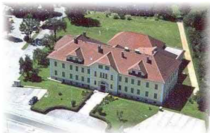
Unser Schulhaus im Zentrum von Kötschach-Mauthen